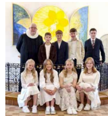
Det øsregnede, da konfirmationen gik i gang, men ikke så snart var vore unge mennesker vel konfirmerede, før solen brød frem... ganske som på Hans Peters altertavle, vi har hængende gennem hele påske.

Gennem sit arbejde som børne- og ungepsykolog i mere end 20 år har hun ganske tydeligt set skiftet komme: Det, der startede som et opgør med den autoritære forælderrolle, er gået hen og blevet til et overdrevent fokus på, hvordan opdragelsen kan perfektioneres. Strømlines. Effektiviseres. Og sidst, men ikke mindst: optimeres, så antallet af fejl i forælderrollen bringes væsentlig ned.