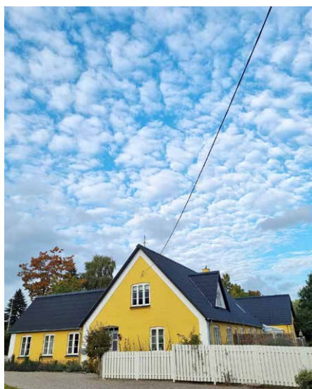
Det store træ ved præstegårdens venstre ende er fældet, så nu kan Ole præst og Vorherre rigtig få en snak om livet og døden og alt det midt imellem.